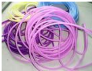
各种材质挤出圆条