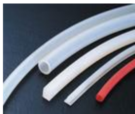
各种材质挤出方条、管